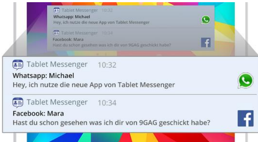
Abbildung 2 Benachrichtigungen vom Tablet Messenger

Bei Nachrichteneingängen gibt der Tablet Messenger eine Benachrichtigung über das Android-Betriebssystem aus. Wenn der Nutzer das bei einem seiner Messenger nicht möchte, kann er mit einem Tastendruck den entsprechenden Messenger einfach stumm schalten. Innerhalb des Tablet Messengers sind diese Nachrichteneingänge dann noch immer sichtbar, es werden aber keine Benachrichtigungen mehr über das Android-System ausgegeben.