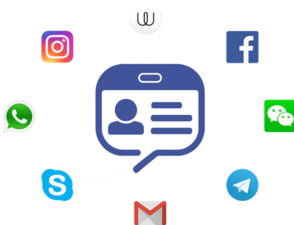
Abbildung 1 Tablet Messenger Logo und unterstützte Messenger (Auswahl)

Tablet Messenger [1] ist eine für Android Tablets optimierte App, die zahlreiche Messenger bündelt. Sie unterstützt unter anderem WhatsApp, Instagram, Facebook Messenger, Telegram, Threema, Skype und 8 weitere Messenger und ist kostenlos in 27 Sprachen im Google Play Store erhältlich [2] .