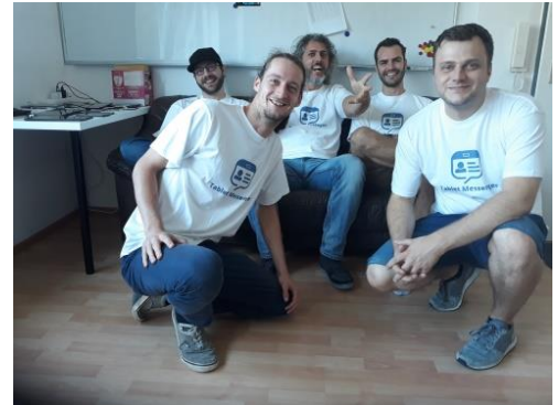
Abbildung 3 Tablet Messenger Team

Messenger „Tablet Messenger“ im Playstore erhältlich.